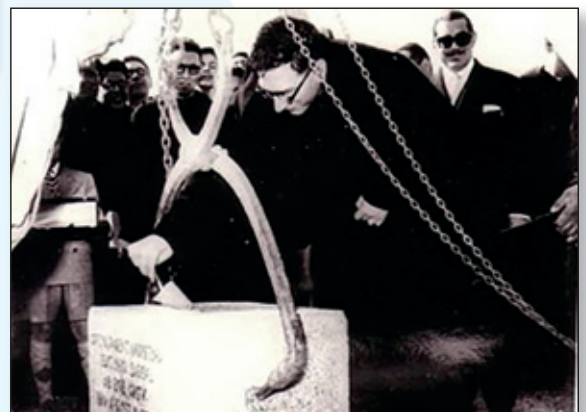
Colocación 1º Piedra (1955-1957).

Trece de noviembre, cumpleaños de San Agustín y día de celebración de todos los Santos y Santas de la Orden de San Agustín. Recordamos de una manera especial la colocación de la 1ª piedra del convento nuevo en Salamanca allá por el 12 de junio de 1955 y donde dos años más tarde, en octubre de 1957, ¡nació la primera comunidad agustiniana en esta nueva casa!