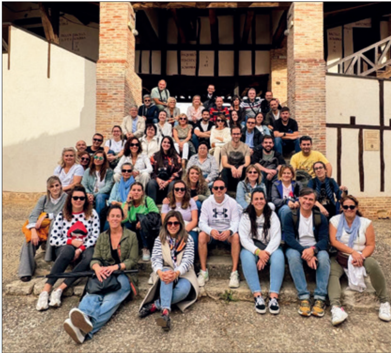
Convivencia Profesorado en Toro. Zamora. Oct. 24.