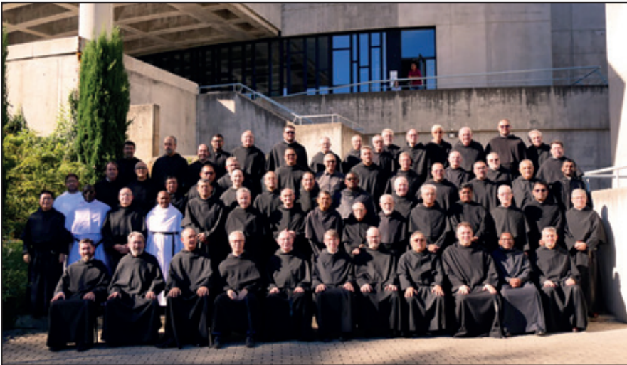
PP Capitulares en Guadarrama. Madrid.

nuestro recuerdo y cariño para él y su familia. Él nos acompañó en varias reuniones, contándonos su vida allá en Tierra Santa, como arqueólogo y estudioso junto al Sepulcro de Jesús y en el Monte Calvario. Aquí dejó sus últimos trabajos, que su vida sea un ejemplo para todos nosotros.