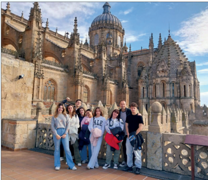
Alumnos de 4º ESO y 2º Bachillerato visitan las Catedrales.

A finales de Septiembre los alumnos de 2º de Bachillerato y 4º de E.S.O., hacen su salida a la naturaleza, día de convivencia por El Maíllo y la Peña de Francia. El primer fin de semana de Octubre el profesorado mantuvo la tradicional convivencia por el inicio de curso, este año han viajado hasta Toro, Zamora; vivencia, formación, encuentro, risas y paseo cultural, buena