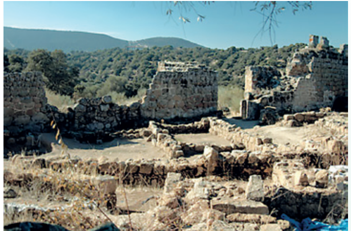
Viviendas y Muralla.

Dos cementerios han sido hallados en la zona de extramuros. Las tumbas superan el centenar y están labradas en piedra y señaladas por cipos.