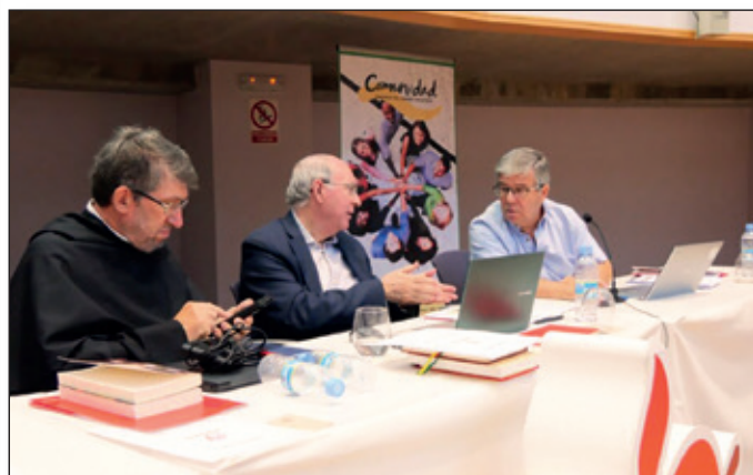
Deliberaciones en la Mesa Presidencial.