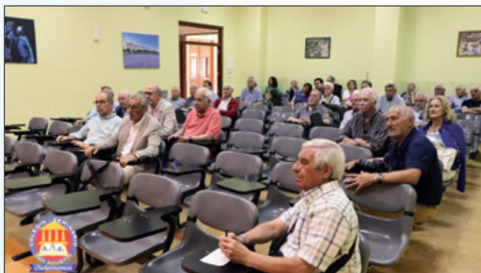
Sala de reuniones, participantes en el encuentro.