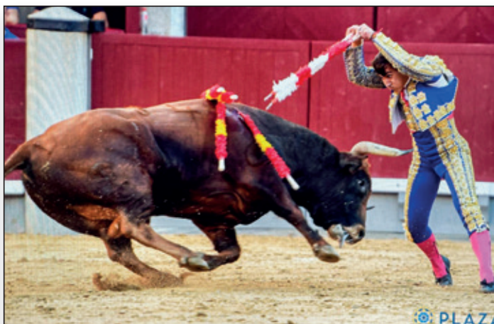
Una de sus grandes virtudes: poderoso banderillero.

Pues diría que Morante, Fandi y Luque, en el orden que quieras ponerlos.