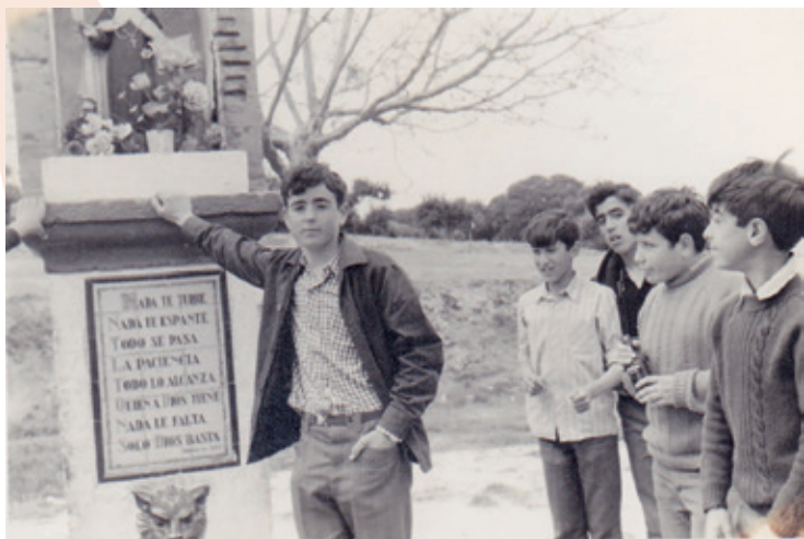
Día de excursión a Alba de Tormes (1970), junto a la Fuente de Santa Teresa.

tora Nacional... Recibe los premios de fotografía de la revista Photo (1976) y el de Agfa (1976). Su cortometraje Retratos en el retrete , protagonizado por Luis García Berlanga y José Sacristán, obtiene una mención especial en el Festival de Cine de Barcelona de 1982 y se proyecta en numerosos cines de toda España. Su tesis doctoral, La convergencia interactiva de medios: hacia la narración hipermedia , logra el Premio Internacional Fundesco de Tesis Doctorales en 1996 dotado con un millón de pesetas, 6000 euros actuales; pero el premio del que se siente más orgulloso es el concedido en su pueblo, Los Navalmorales, en 2024: el Olivo de Plata por su trayectoria profesional.