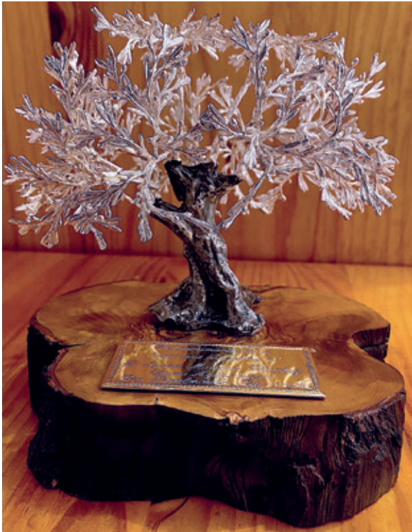
El Olivo de Plata concedido por el Ayuntamiento de Los Navalmorales.