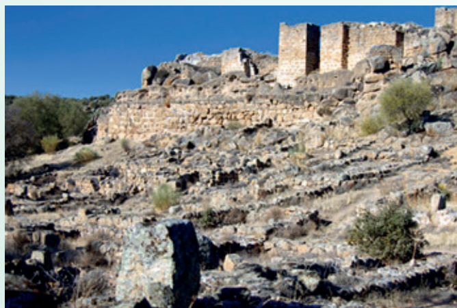
Alcazaba vista desde la Madina.

Uno de los hallazgos más importante durante las excavaciones fue el de la mezquita, de planta trapezoidal, con una longitud de 20 metros, anchura de 7 a 10 metros, y una superficie total de 130 metros cuadrados. Consta de un pequeño zaguán y una sala de oración, que se distribuía en cuatro naves separadas por hileras de columnas. Los arcos que sostenían las columnas centrales eran de herradura fabricados con ladrillos.