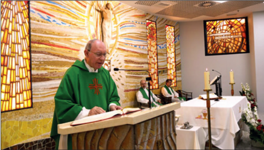
Eucaristía, Final del II Capítulo.