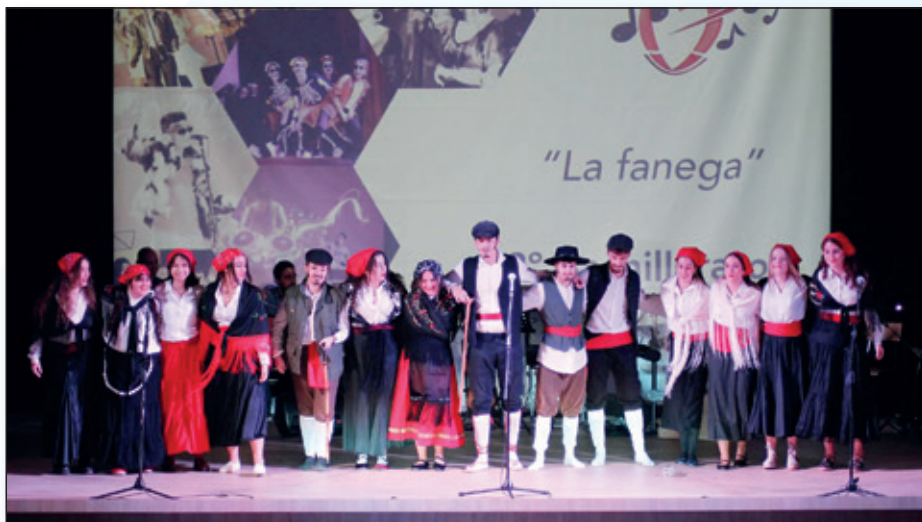
Actuación en Santa Cecilia 2024.