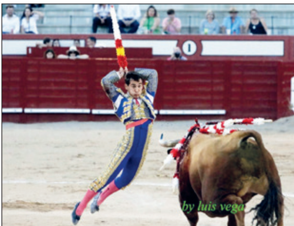
Banderilleando y pase de pecho en Las Ventas, donde cortó una oreja en la Feria de San Isidro.

Importantísimo, principal y vital es la vocación y motivación personal. Sin vocación y plena dedicación, no se puede conseguir casi nada.