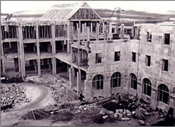
Obras del Colegio (1955-1957).