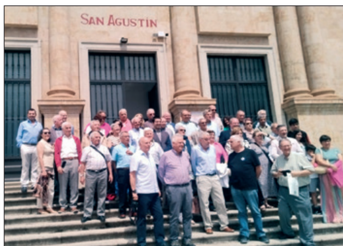
Foto de familia, como es tradición.