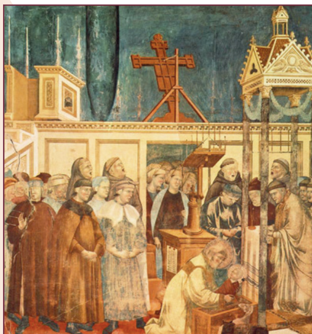
Giotto. Fresco en la Basilica Mayo de Asís. Año 1299.

El santo de Dios viste los ornamentos de diácono, pues lo era, y con voz sonora canta el santo evangelio. Su voz potente y dulce, su voz clara y bien timbrada, invita a todos a los premios supremos. Luego predica al pueblo que asiste, y tanto al hablar del nacimiento del Rey pobre como de la pequeña ciudad de Belén dice palabras que vierten miel. Muchas veces, al querer mencionar a Cristo Jesús, encendido en amor, le dice «el Niño de Bethlehem», y, pronunciando «Bethleem» como oveja que bala, su boca se llena de voz; más aún, de tierna afeción. Cuando le llamaba «niño de Bethlehem» o «Jesús», se pasaba la lengua por los labios como si gustara y saboreara en