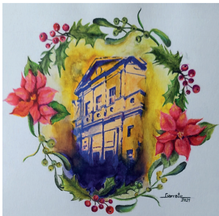
Postal realizada por Domingo Garrote.