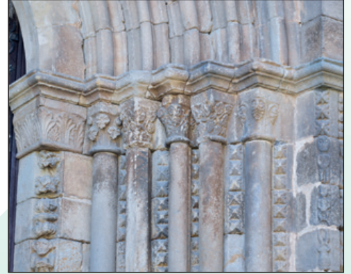
Detalle jamba derecha portada occidental.