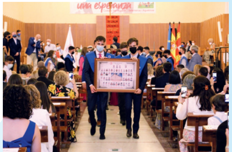
2º Bachillerato. Celebración en la capilla.