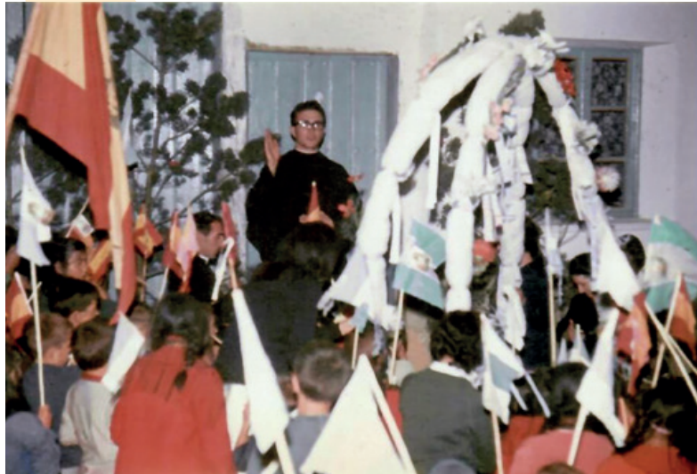
Recibimiento del pueblo..