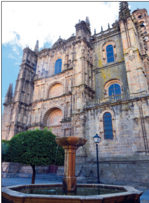
Panorámica general portada norte.