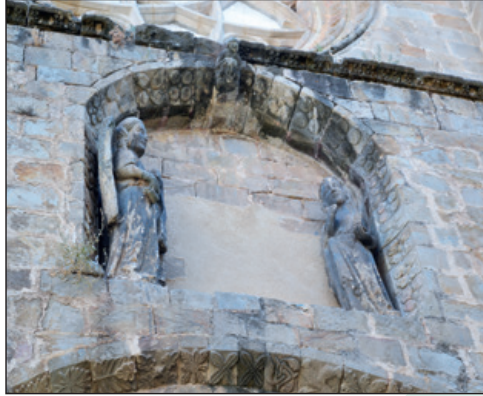
Anunciación sobre portada occidental.