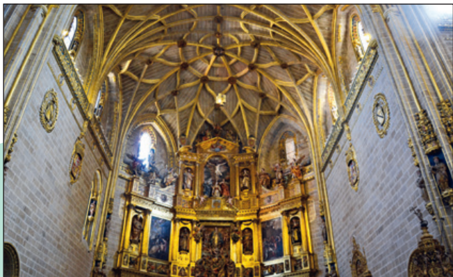
Bóveda gótica de finas nervaduras con entramados geométricos.

que corona el ático, el Padre Eterno domina todo el espacio catedralicio.