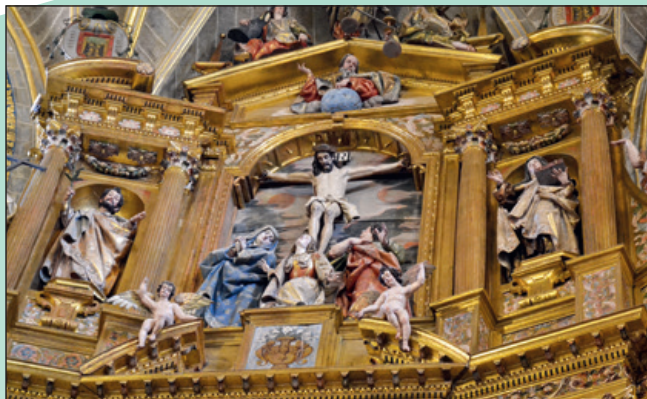
Detalle retablo mayor. Calvario.