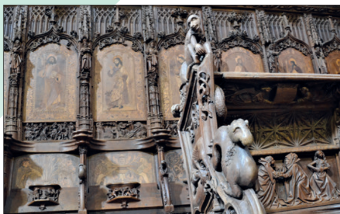
Sillería del coro.