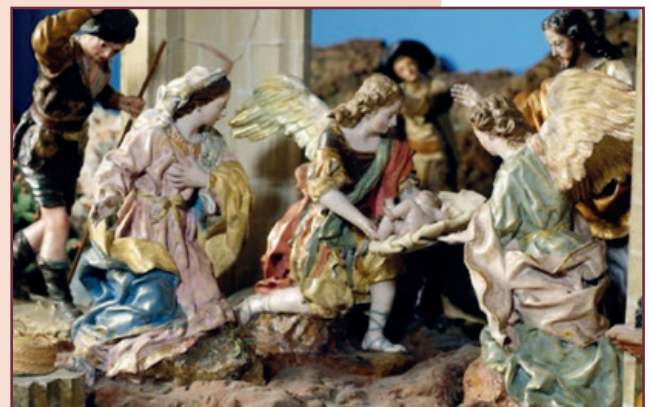
Detalle del Belén de Salzillo. Museo de Salzillo .Murcia