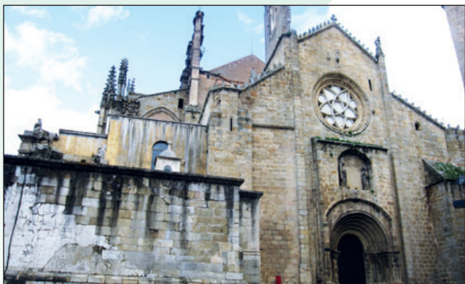
Panorámica fachada occidental.

Encima del arco, una sencilla hornacina, con un grupo escultórico, la Anunciación de Nuestra Señora.