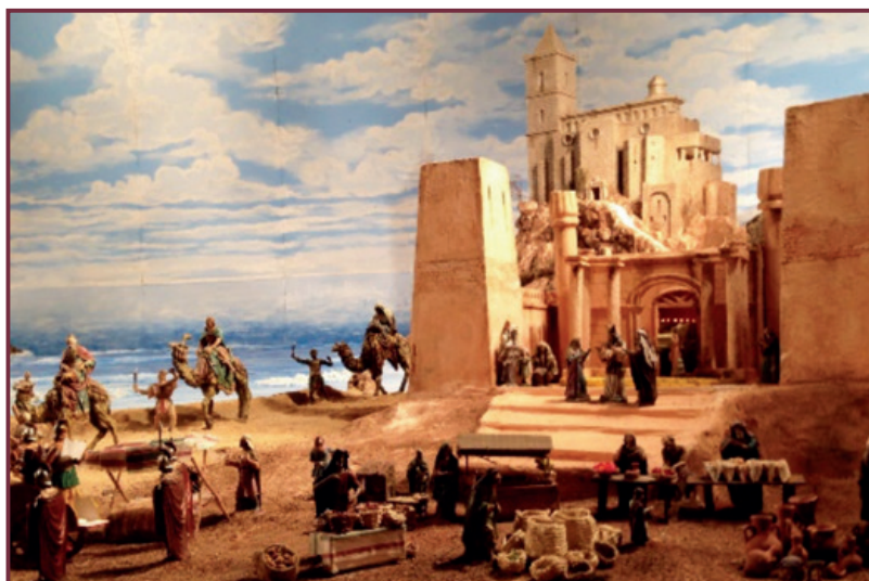
Belén de La Roda 2013.

una tradición que perdura hasta nuestros días.