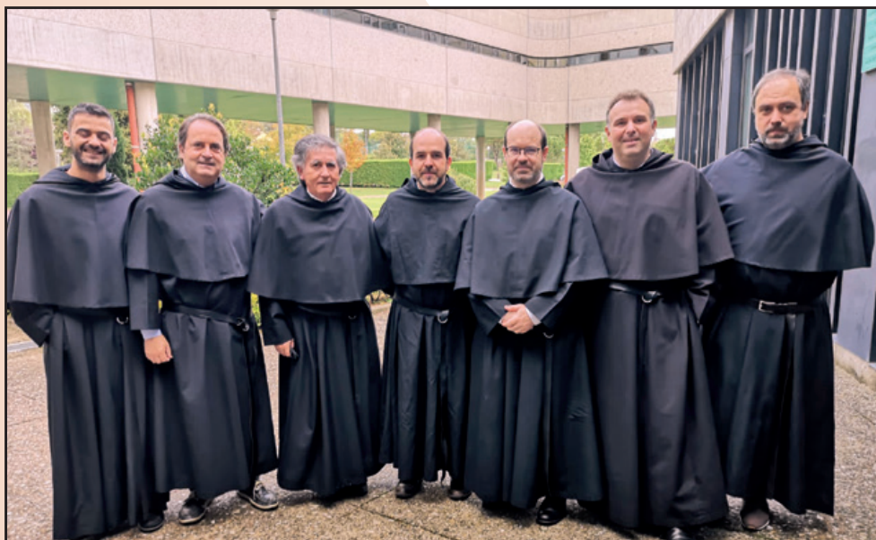
Grupo de hermanos. Capítulo Provincial, septiembre de 2021. 3º por la derecha.

También me gustaría tener un recuerdo muy especial para los profesores de aquella época, el personal y mis compañeros. A todos ellos debo, no sólo una colección de momentos que aún conservo, sino, sobre todo, algo que es menos evidente pero más sustancial: el sedimento que me proporcionó la vida tal y como la viví junto a quien la Providencia quiso poner a mi lado. Deo gratias.