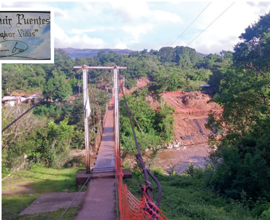
Puente P. Moisés y Río Tabasará.