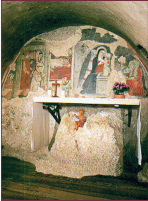
Greccio. Gruta del Nacimiento.

su paladar la dulzura de estas palabras.