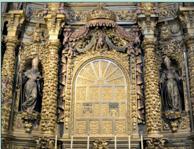
Santo Tomás de Villanueva a la derecha y de san Fulgencio de Ruspe a la izquierda.