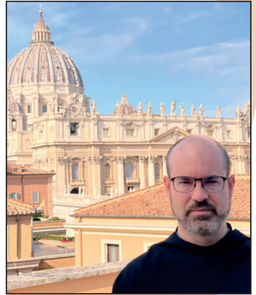
Desde la Curia General.

Nada puede sustituir el conocimiento directo y presencial de los hermanos, las comunidades y las obras apostólicas. El Prior General debe visitar personalmente o por medio de sus asistentes las distintas casas de la Orden y hacerse presente en la medida de lo posible en acontecimientos importantes: capítulos provinciales, celebraciones... Este conocimiento de fondo es el que da el sentido justo y pone el contexto a las informaciones que van llegando después de forma ordinaria. Es absolutamente imprescindible. Al margen de esto, se producen comunicaciones oficiales por medio de actas e informes y otras que podríamos llamar cotidianas, que son la mayoría, sencillamente mediante conversaciones entre miembros de la curia y los hermanos de las circunscripciones, especialmente los superiores, consejeros y secretarios. Las distintas Comisio-