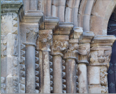
Detalle jamba izquierda portada occidental.