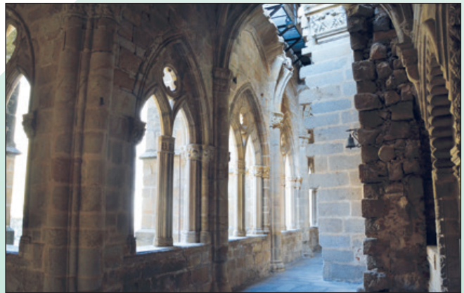
En el tramo este del claustro confluyen las catedrales. Se ven los muros incompletos en sus sillares.