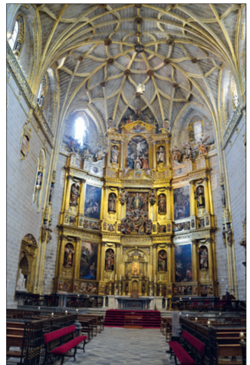
Panorámica general de la Catedral Nueva.

está representado el momento en el que la Virgen, representada como Inmaculada, es elevada al cielo en medio de un coro de ángeles, mientras los apóstoles se agrupan en torno