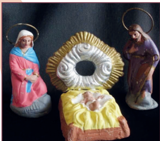
Belén del huevo frito.