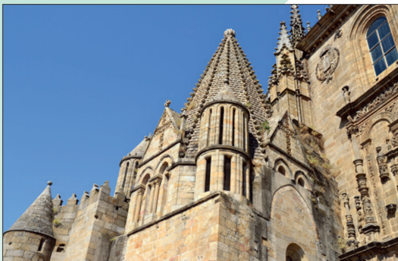
Panorámica exterior Torre del Melón.