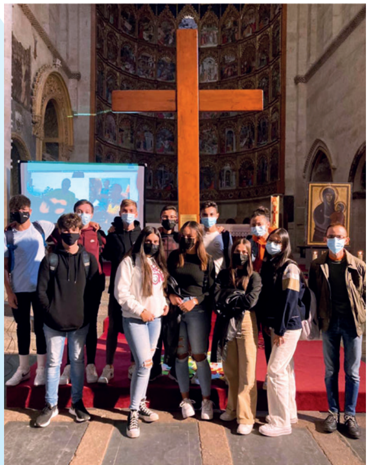
Alumnos de 1º Bachillerato con la Cruz de los Jóvenes.

Entre el 10 y el 16 de septiembre vuelta de nuevo a las clases, nuestros alumnos de Infantil y Primaria retornan con precaución y cuidado, pero con emoción e ilusión así como los alumnos de ESO y Bachillerato.