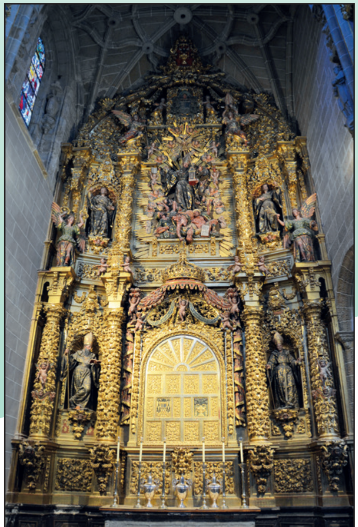
Panorámica general del retablo de las reliquias.