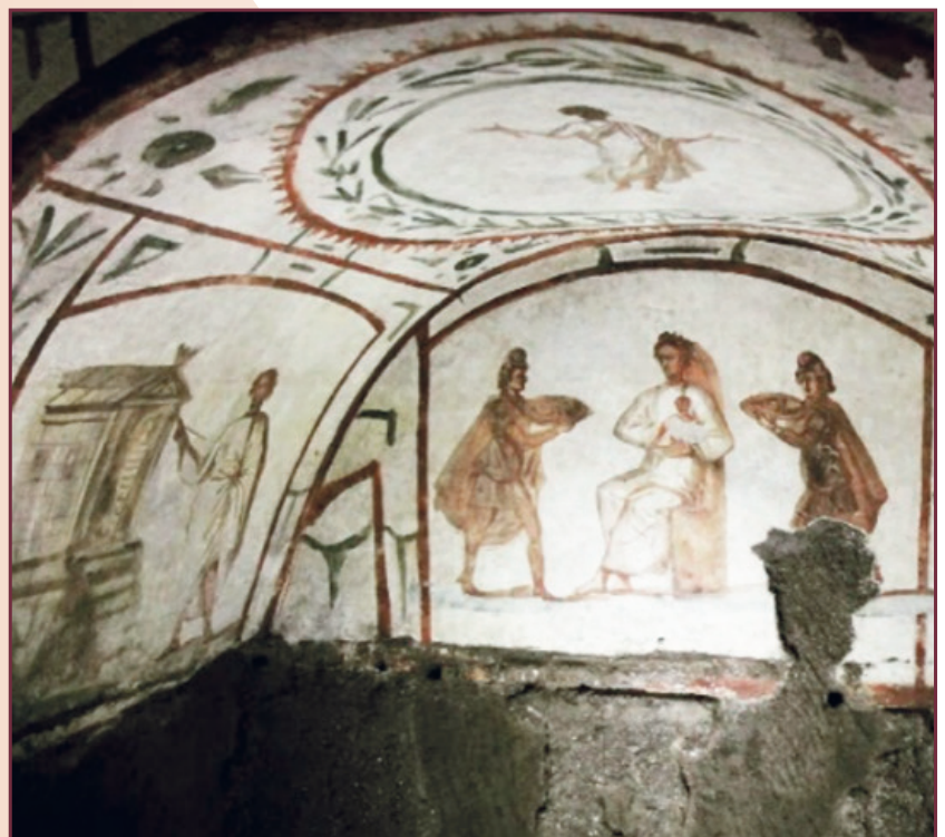
Adoración Reyes Magos s. IV. Catacumbas de Pedro y Marcelino.