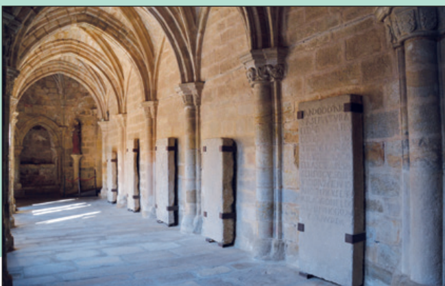
Lápidas sepulcrales. Claustro, lado norte.