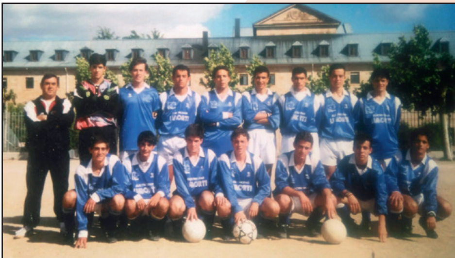
Equipo de fútbol San Agustín. Fila de abajo-3º por la izquierda.

¿Qué grado de cambio ha experimentado tu vida, con tu llegada y establecimiento en la Curia Generalicia, en Roma, tras los años de docencia y dirección que venías ejerciendo en el Colegio