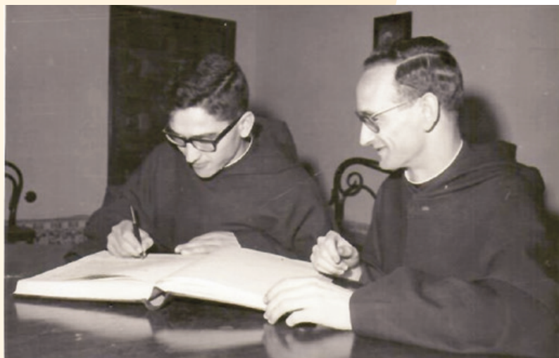
Profesión del P. Moisés.

Su muerte fue considerada desde el primer momento como un signo martirial de entrega de un verdadero apóstol del evangelio.