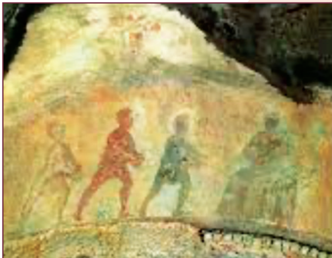
Primera representación de Los Reyes Magos en la Catacumba de Santa Priscila.

Pero será en la Navidad de 1223 cuando se considera que se montó el primer belén; lo hizo San Francisco de Asís en Grecia, uno de los cuatro santuarios que él mismo fundó en el Valle Sagrado. El lugar se encuentra en una empinada ladera de las