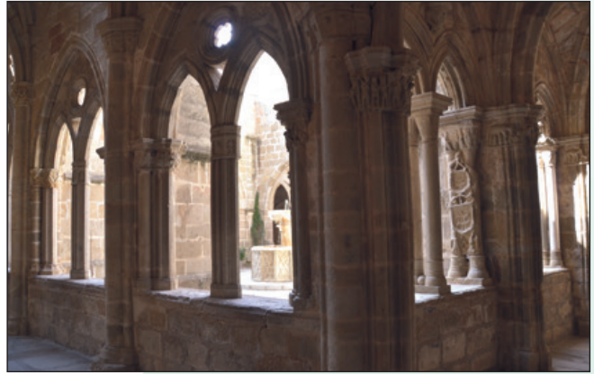
Detalle arcos góticos.