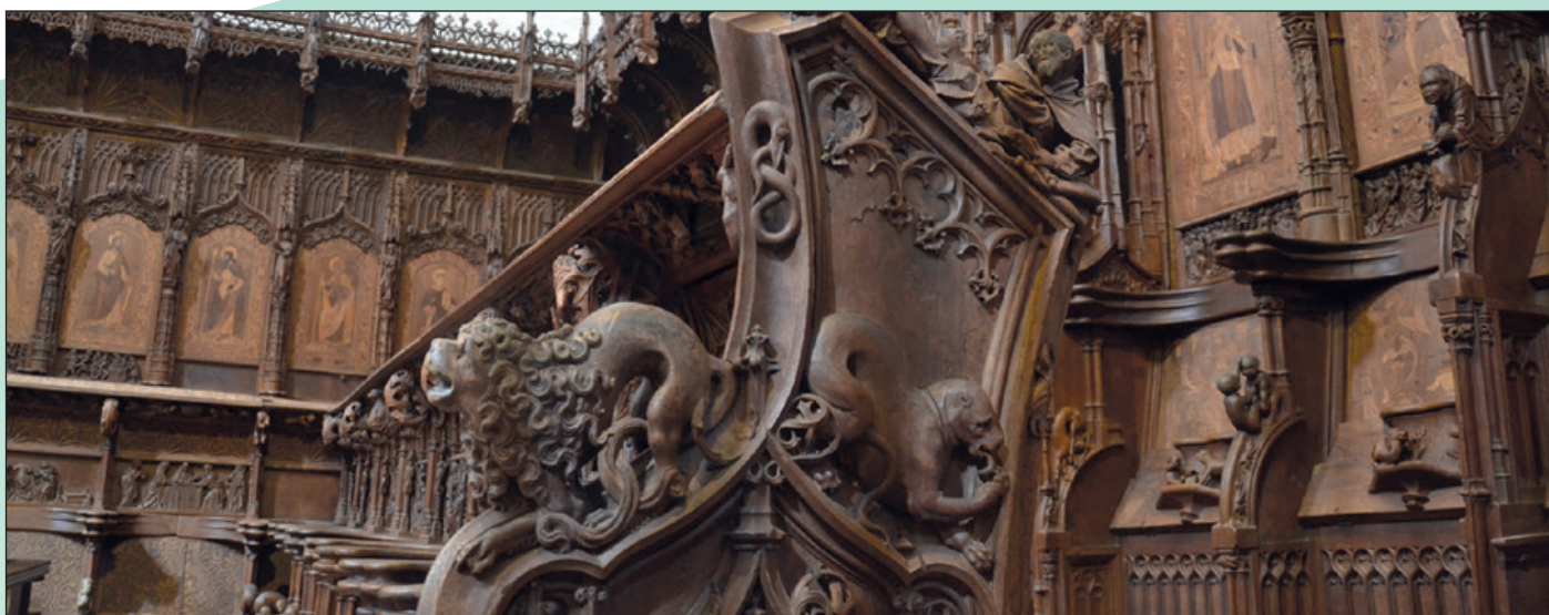
Detalle sillería del coro.

en los brazos y en las misericordias están representadas escenas históricas y escenas de personajes de la vida cotidiana.