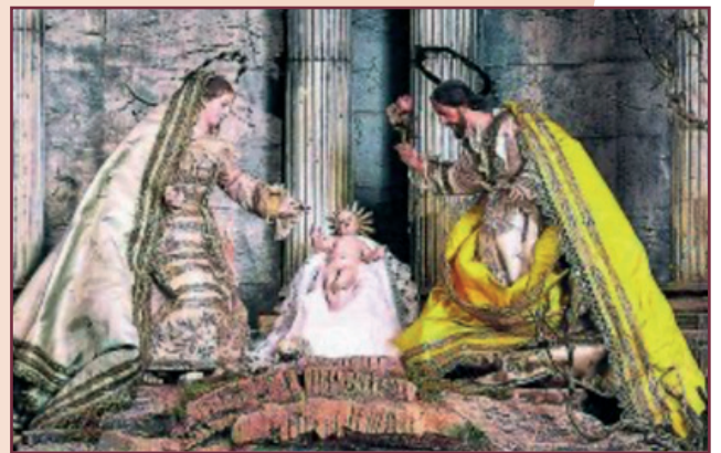
Belén de Carlos III. Palacio Real de Madrid.

De la misma época, y uno de los más famosos de España es el belén realizado por Francisco Salzillo en 1783, compuesto por 556 personajes y 372 animales, además de algunas maquetas de edificios. Este escultor murciano se convierte así en la referencia para muchos artistas, a la vez que el precursor de un arte que, en su región, tendrá un extraordinario desarrollo y será