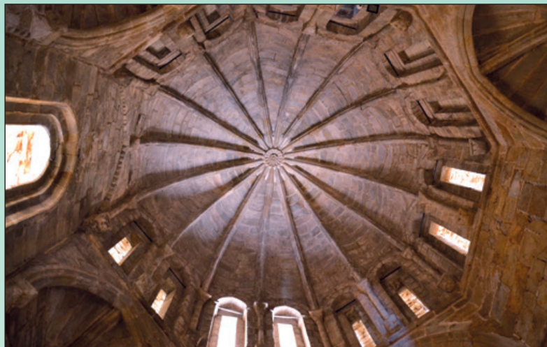
Interior cúpula de la Torre del Melón.