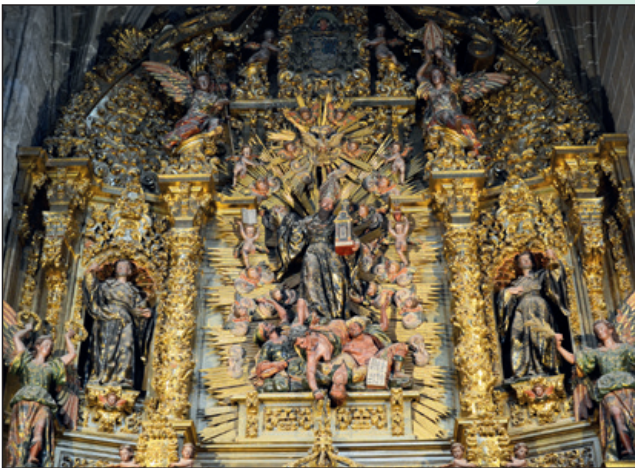
San Agustín en el centro del retablo, en el lado izquierdo san Nicolás de Tolentino y en el lado derecho san Juan de Sahagún.