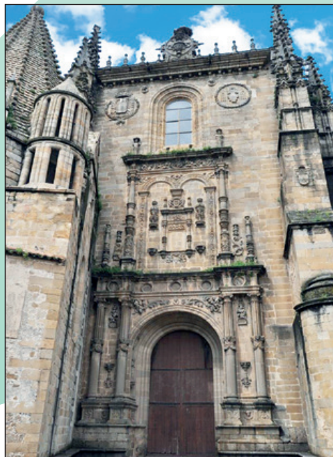
Portada sur o de El Enlosado.