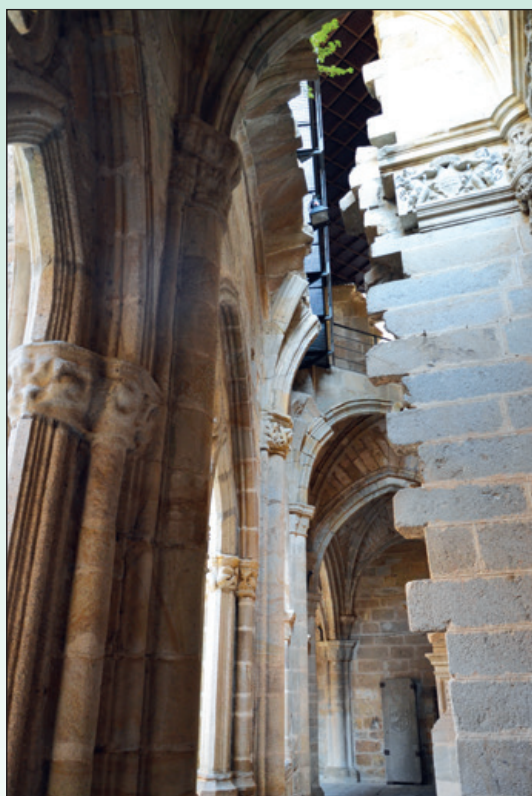
Tramo este del claustro. Confluencia de las catedrales.