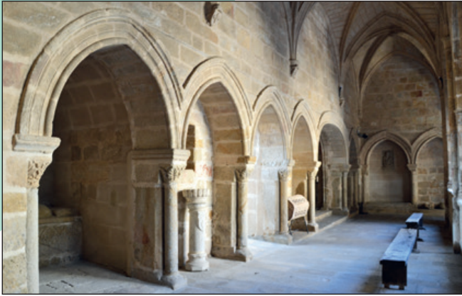
Claustro, tramo oeste.