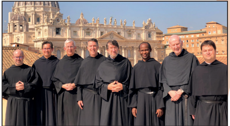
Consejo General OSA. 1º por la izquierda.

Sin duda. Un colegio es un lugar lleno de vida y de vidas, de expectativas, de promesas,