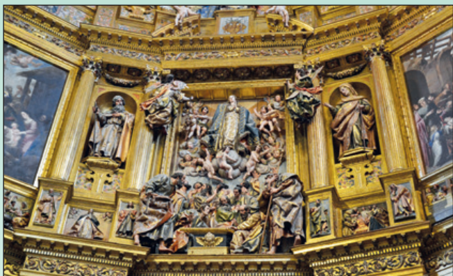
Detalle retablo mayor. La Asunción de la Virgen María.