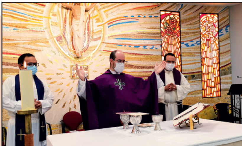
Celebrando misa Capítulo Provincial. Septiembre de 2021.

¿Qué criterios guían el diseño y organización de viajes y visitas pastorales del Prior General y/o de los miembros de su Consejo a cada una de las demarcaciones geográficas establecidas?