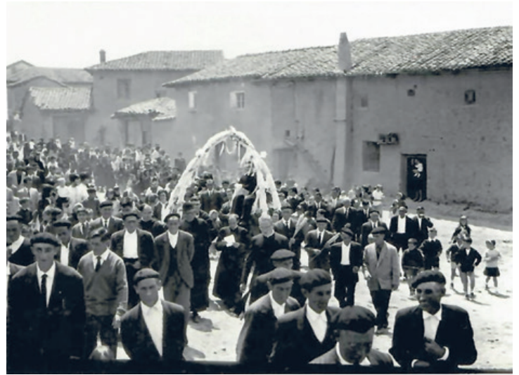
Cantamisa en el pueblo..