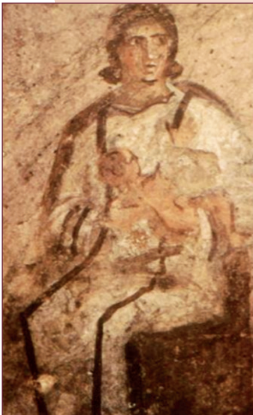
La Virgen con el Niño. Catacumba Santa Priscila.