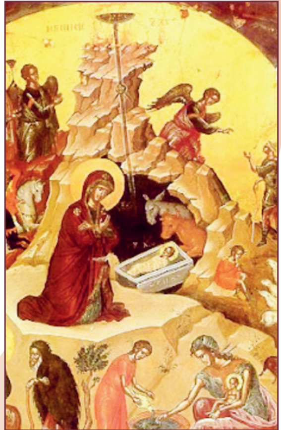
Icono de Theófanos de Creta 1546.

sentaciones del nacimiento del Señor se repiten en los capiteles de las iglesias románicas como parte de la catequesis dirigida a los fieles. Ejemplos hay muchos, pero puestos a elegir destacamos, por su belleza y estado de conservación, el que se encuentra en el arco de entrada a la capilla norte del monasterio de San Juan de Ortega (Burgos), del siglo XII, que representa el ciclo de la Natividad que va desde la escena de la Anunciación hasta la adoración de los pastores.