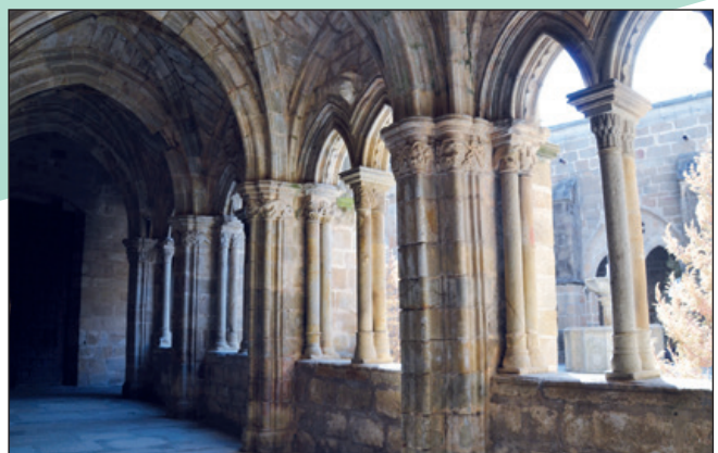
Panda sur del claustro.