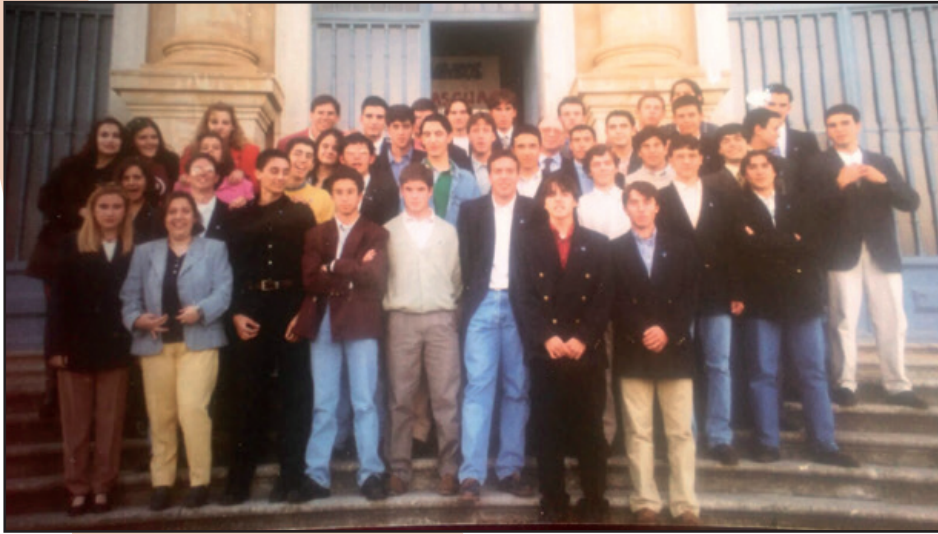
Compañeros San Agustín. 1ª fila, 4º por la izquierda.

Los Olivos, en Málaga? ¿Por qué criterios y valores crees que has sido nombrado Consejero, es decir, miembro del equipo de gobierno del Prior General de la Orden?