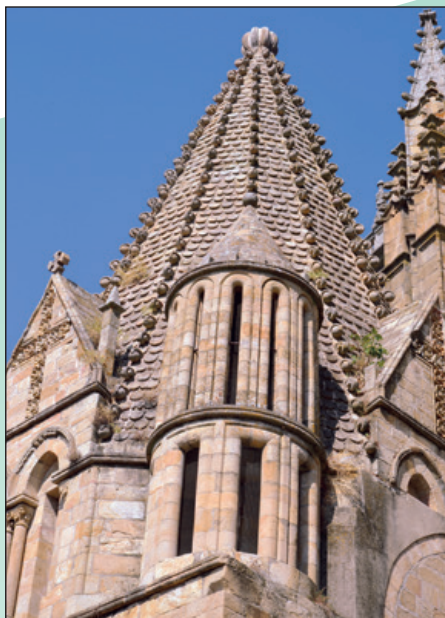
Exterior Torre del Melón.

está recubierta de escamas de cantería de clara inspiración bizantina.