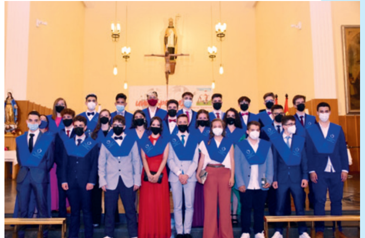
2º Bachillerato. Graduación.