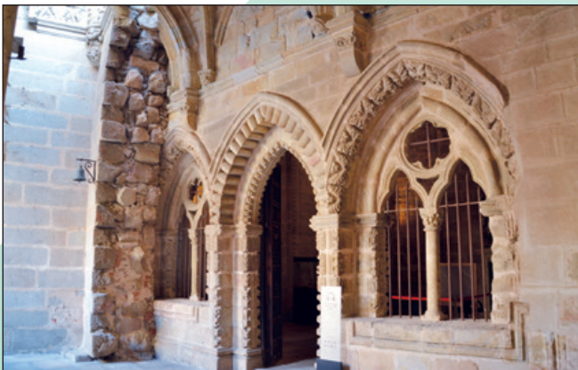
Entrada sala capitular.