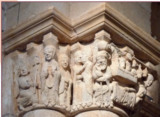
Capitel en San Juan de Ortega.

montañas, y parece surgir de la roca desnuda. Pero será mejor que narre este hecho Tomás de Celano, que fue compañero y hagiógrafo de san Francisco: