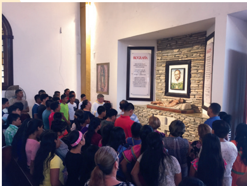
Oración ante el sepulcro del P. Moisés.

perseverado hasta la muerte en este propósito. O como indica sucintamente el Art. 1 de esta Carta: “El ofrecimiento de la vida es un nuevo caso del iter de beatificación y canonización, distinto del caso de martirio y de heroicidad de las virtudes .