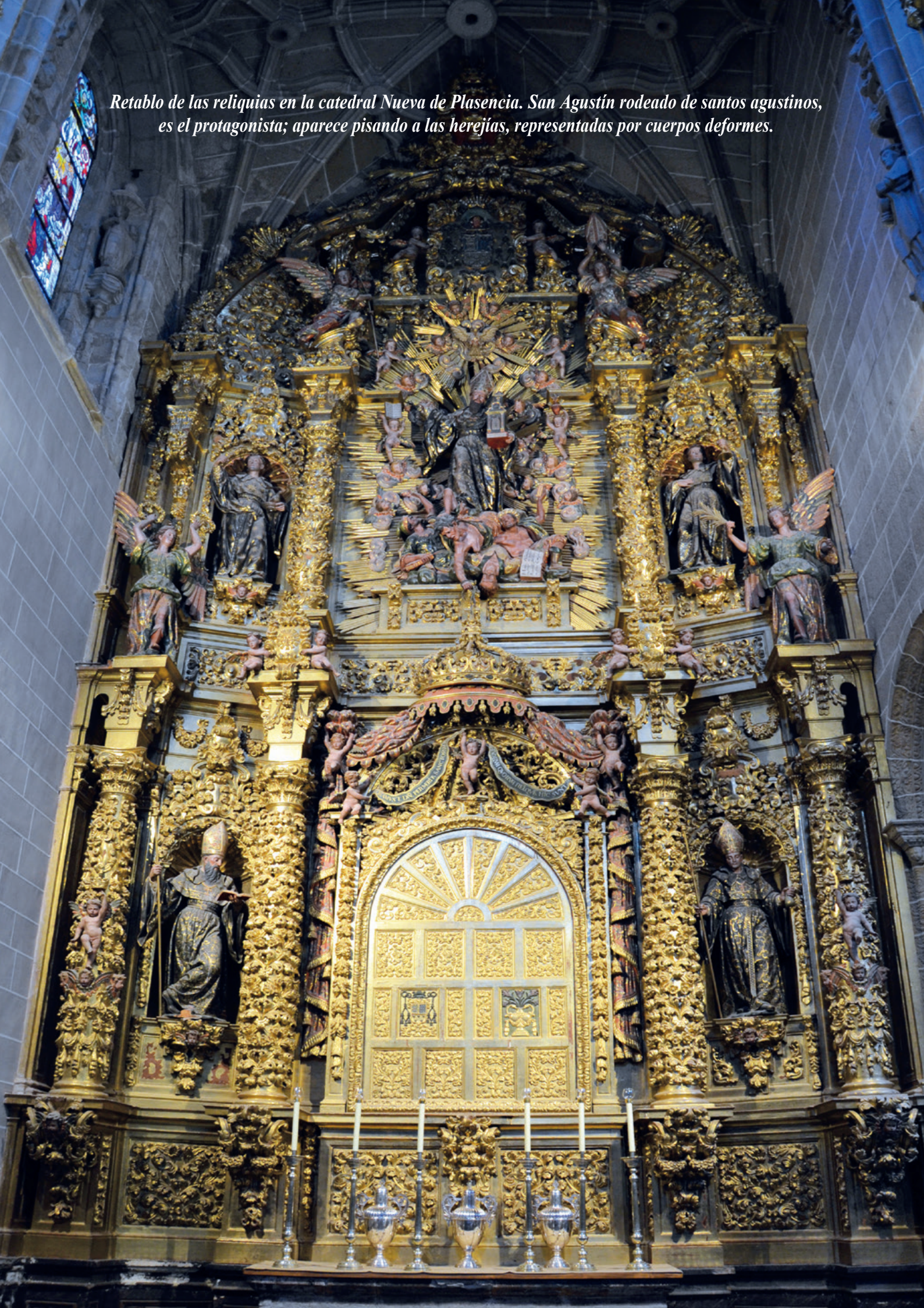
Retablo de las reliquias en la catedral Nueva de Plasencia. San Agustín rodeado de santos agustinos, es el protagonista; aparece pisando a las herejías, representadas por cuerpos deformes.